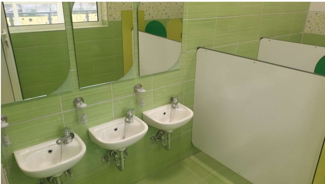
Слика 7. Изградња дечијег вртића у насељеном месту Кушиљево, општина Свилајнац