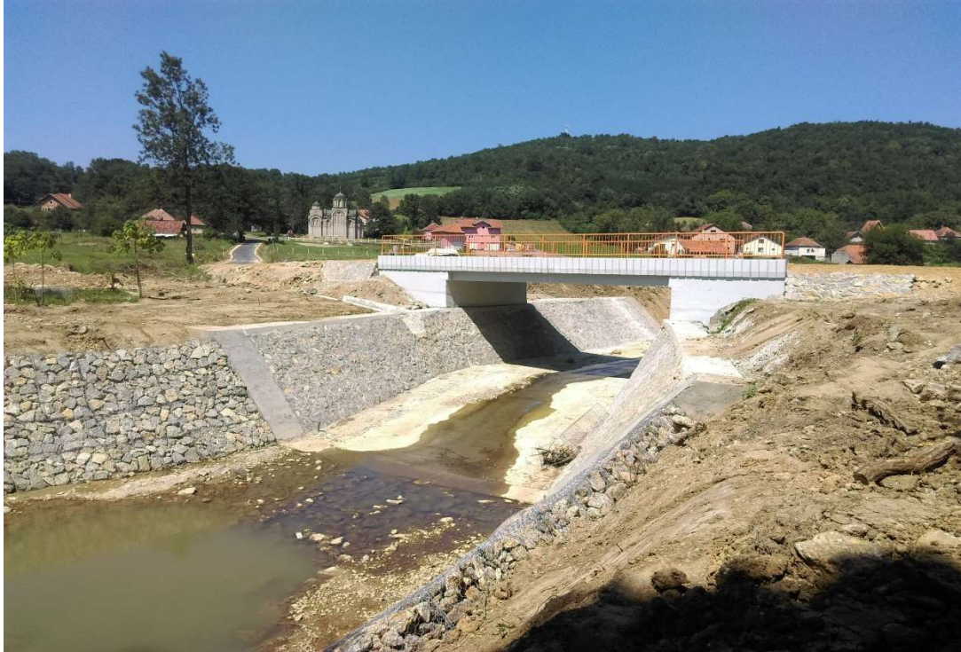
Слика 13. Реконструкција моста у Вишевцу, општина Рача

Током 2016,2017, 2018 и 2019 године смо реконструисали и изградили мостове.