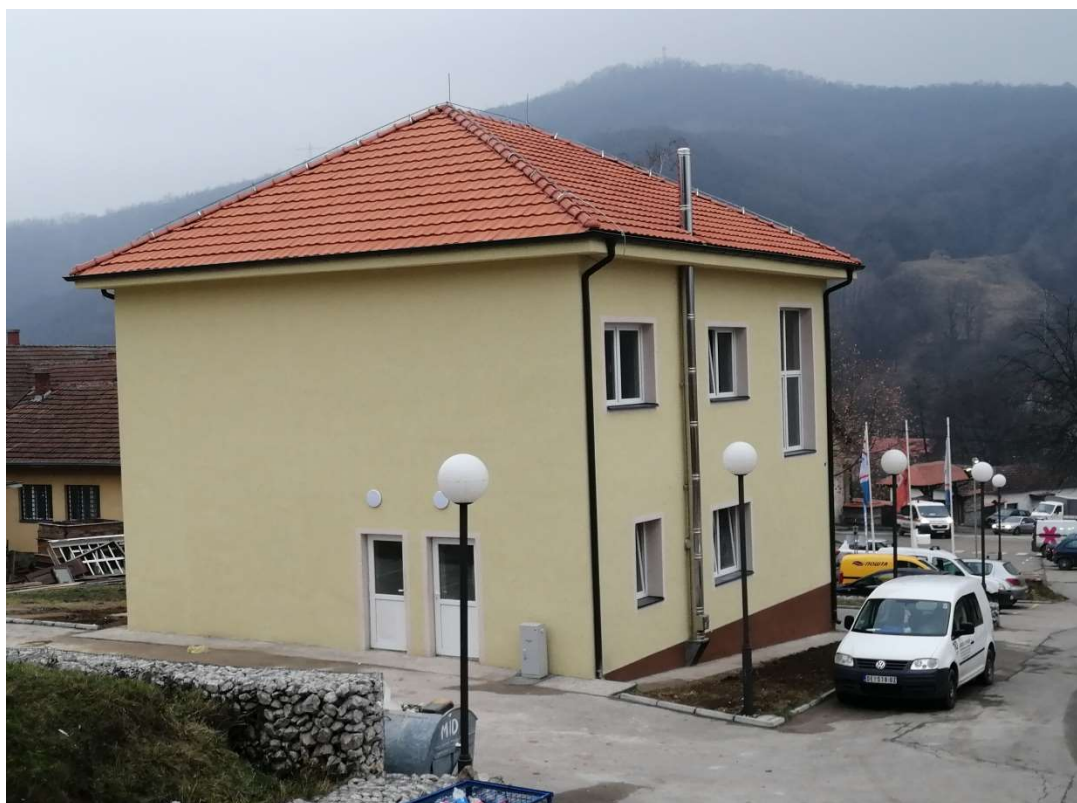
Слика 10. Објекат Реконструкција дечијег вртића у Крепољину, општина Жагубица