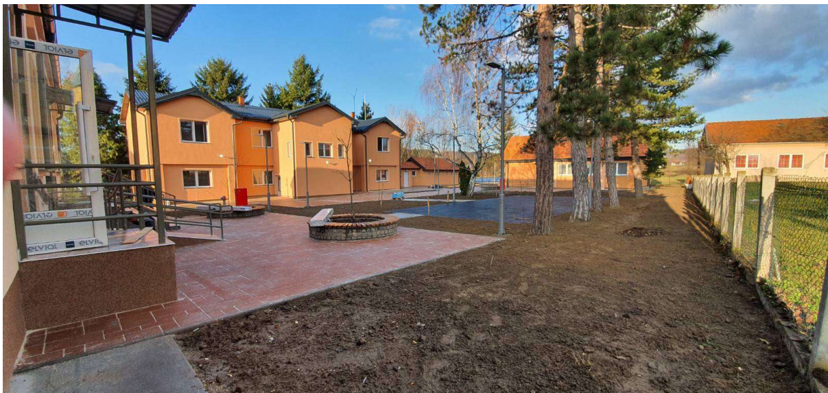
Слика 9. Грађевински радови на реконструкцији школског комплекса и изградњи помоћног објекта - котларнице и постројења за повећање притиска воде истуреног одељења ОШ "Свети Сава" у Бадњевцу, општина Баточина