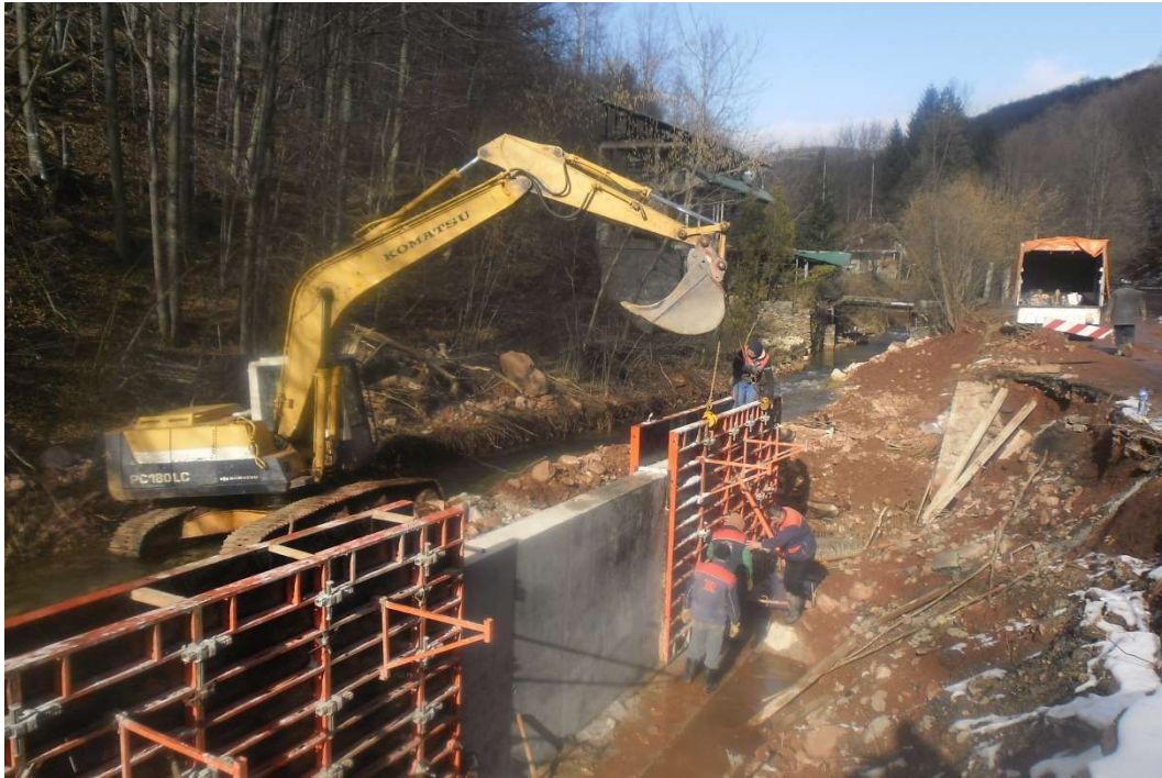
Слика 23. Радови на државном путу Грза - Сисевац

За сопствене потребе изградил смо пословну зграду са халом за смештај сопствене механизације