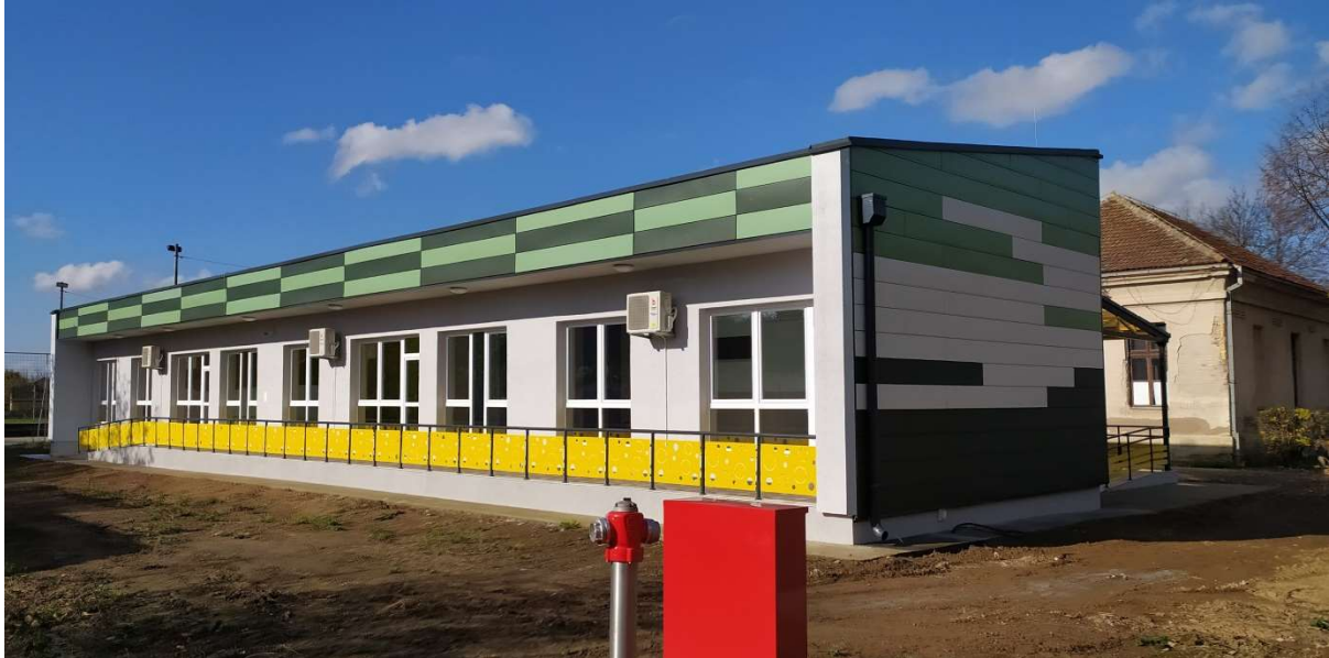
Слика 4. Изградња дечијег вртића у насељеном месту Кушиљево, општина Свилајнац

У периоду од 2019 до 2020 године изградил смо нови објекат дечијег вртића у насељеном месту Кушиљево, општина Свилајнац.