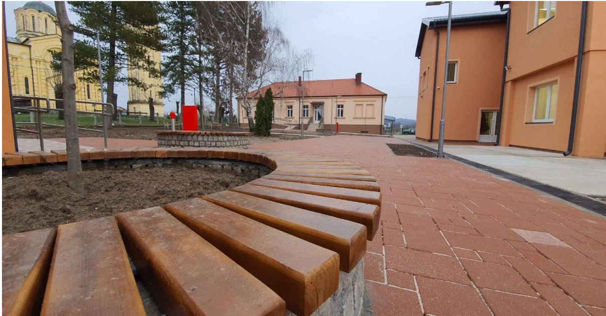
Слика 8. Грађевински радови на реконструкцији школског комплекса и изградњи помоћног објекта - котларнице и постројења за повећање притиска воде истуреног одељења ОШ "Свети Сава" у Бадњевцу, општина Баточина

2020. године смо реконструисали школски комплекс у Бадњевцу, општина Баточина.