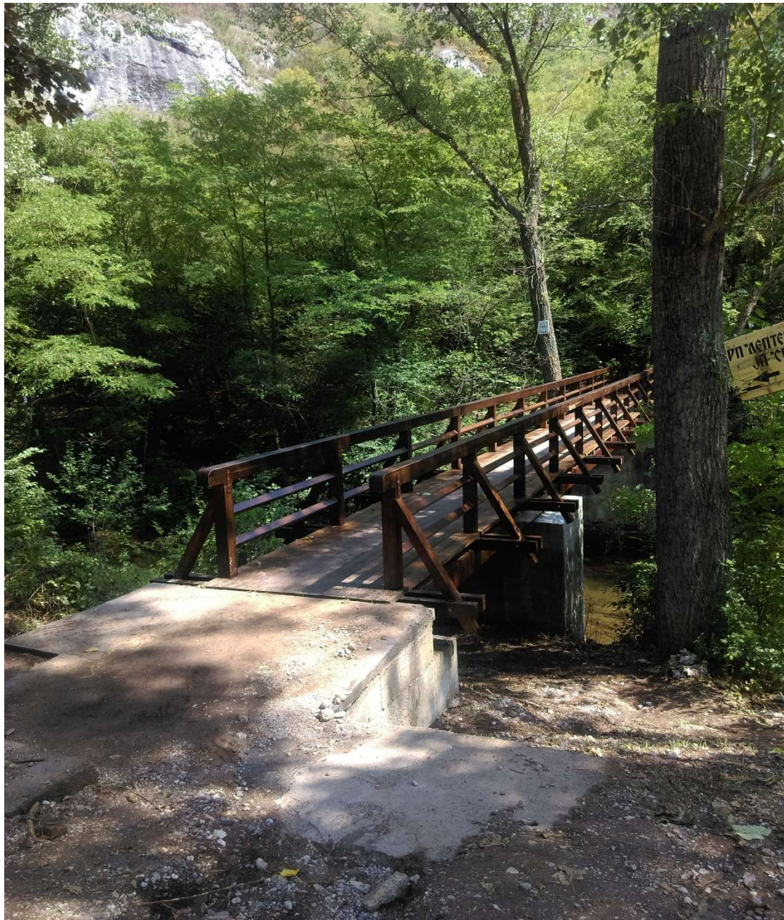
Слика 17. Објекат Изградња дрвеног моста на Лептерији, општина Сокобања