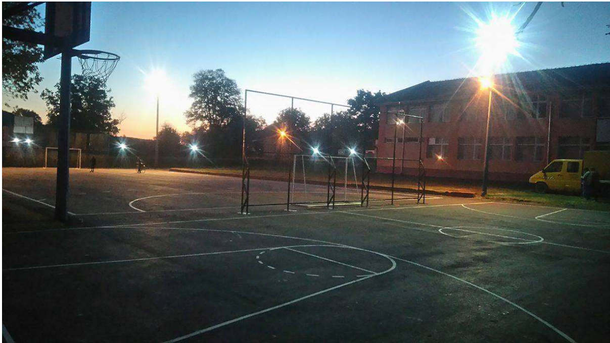
Слика 19. Објекат Изградња спортских терена у Новом Брчину Општина Ражањ.