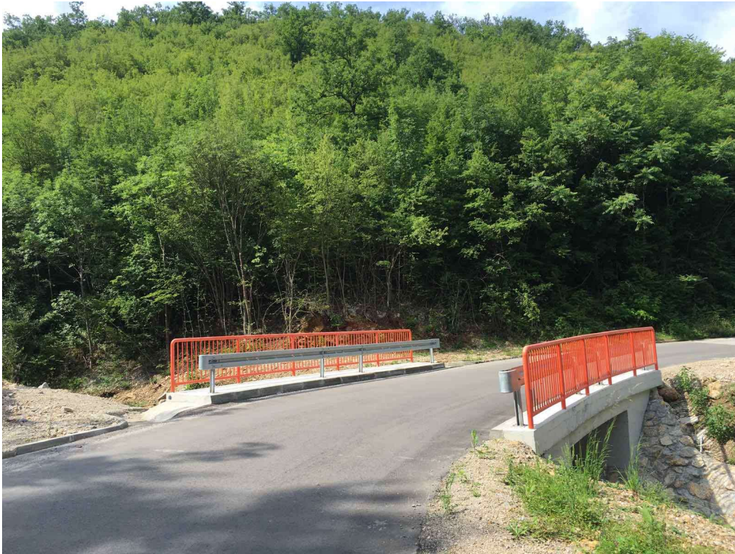
Слика 15. Објекат Реконструкција пропуста на деоници пута Буковац-Пањевац, општина Деспотовац