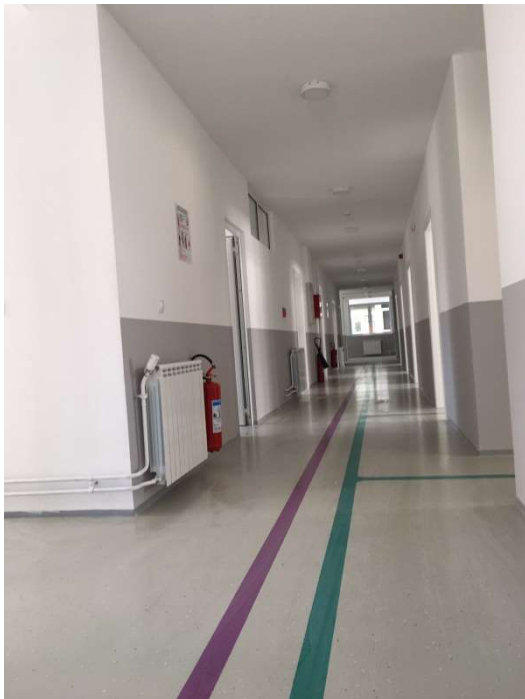
Слика 3. Дом здравља Деспотовац