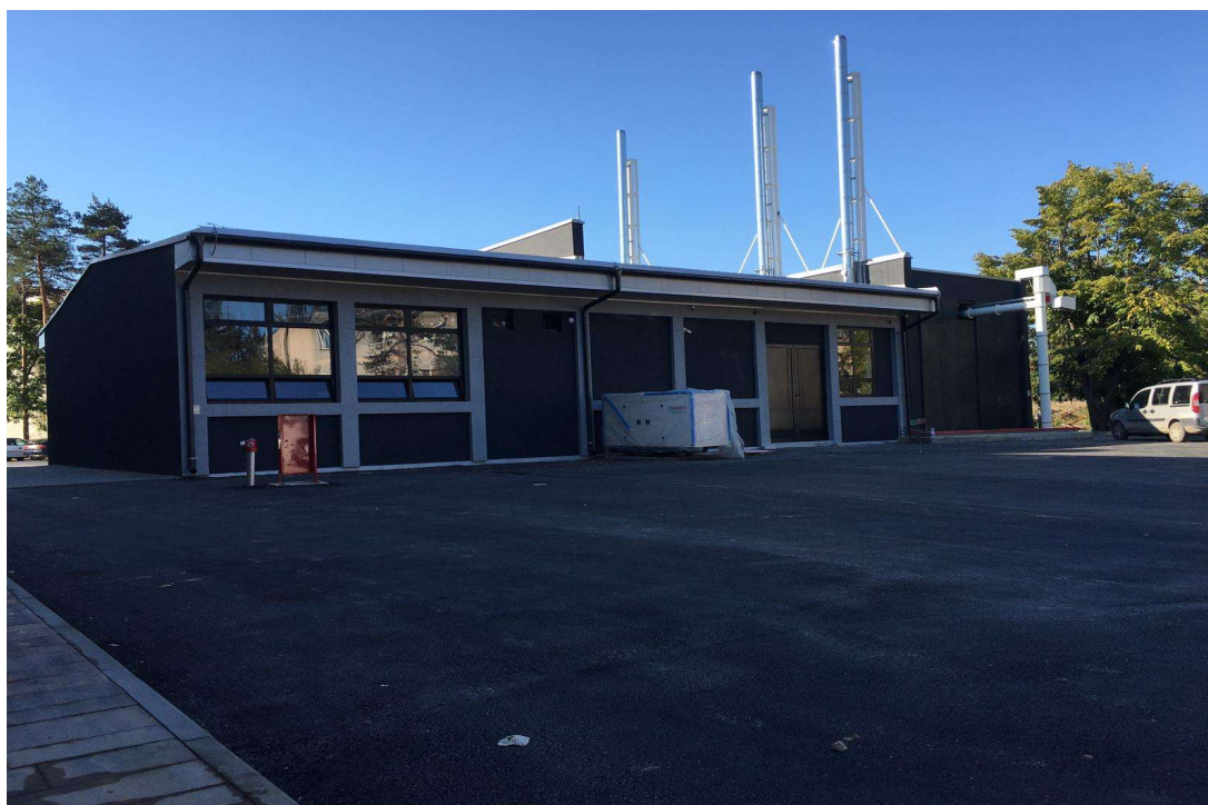
Слика 11. Објекат Грађевински радови на изградњи котларнице на дрвну сечку у Техничкој школи у Деспотовцу