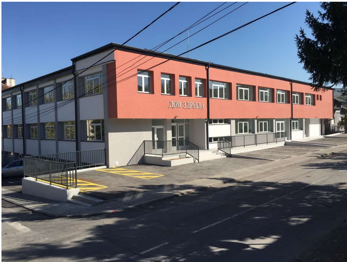
Слика 1. Реконструкција и доградња објекта Дома здравља у Деспотовцу

Као и од самог основања, па и до данашњих дана, у континуитету, сада већ седамнаест година, наше предузеће се бави пословима везаним за изградњу и реконструкцију објеката, како у нискоградњи тако и у високоградњи. У задњих пар година редили смо реконструкцију и изградњу објеката и то на првом месту Реконструкцију и доградња објекта Дома здравља у Деспотовцу.