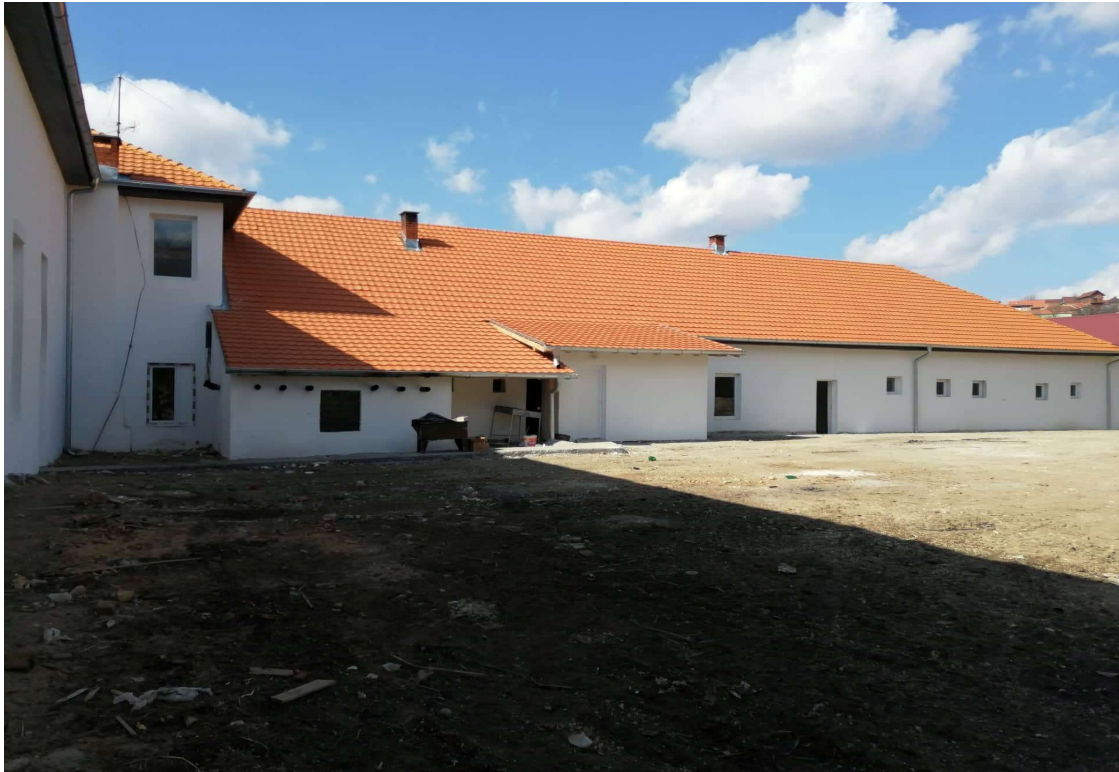
Слика 12. Реконструкција Дома културе у Лазници, општина Жагубица