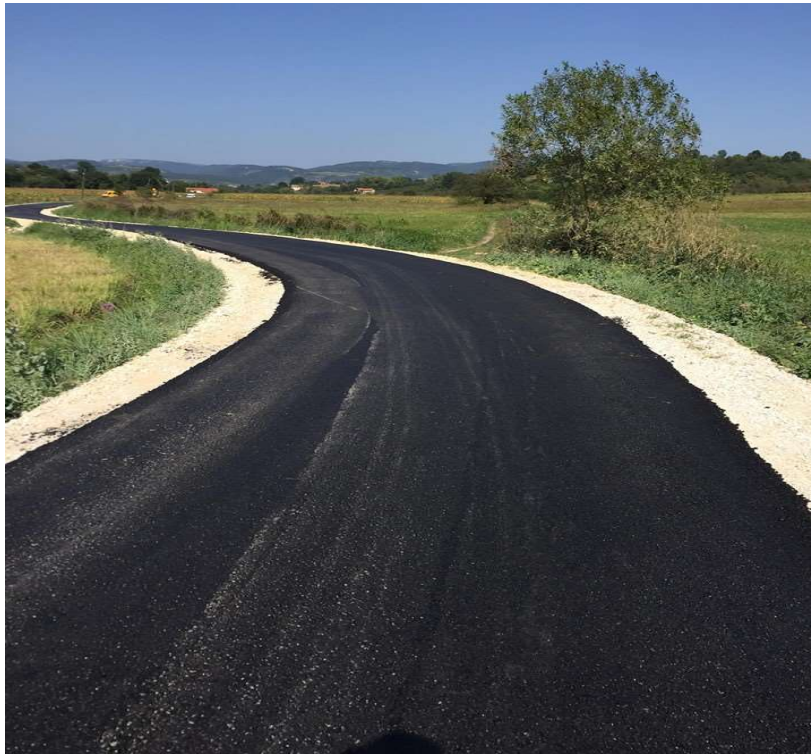
Слика 18. Објекат Изградња пута у дужини од 5,50 км општина Жагубица