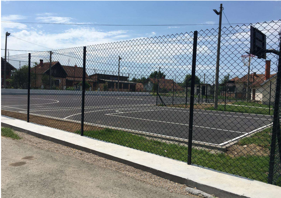
Слика 21. Објекат Изградња спортског терена у насељеном месту Дубница, општина Свилајнац