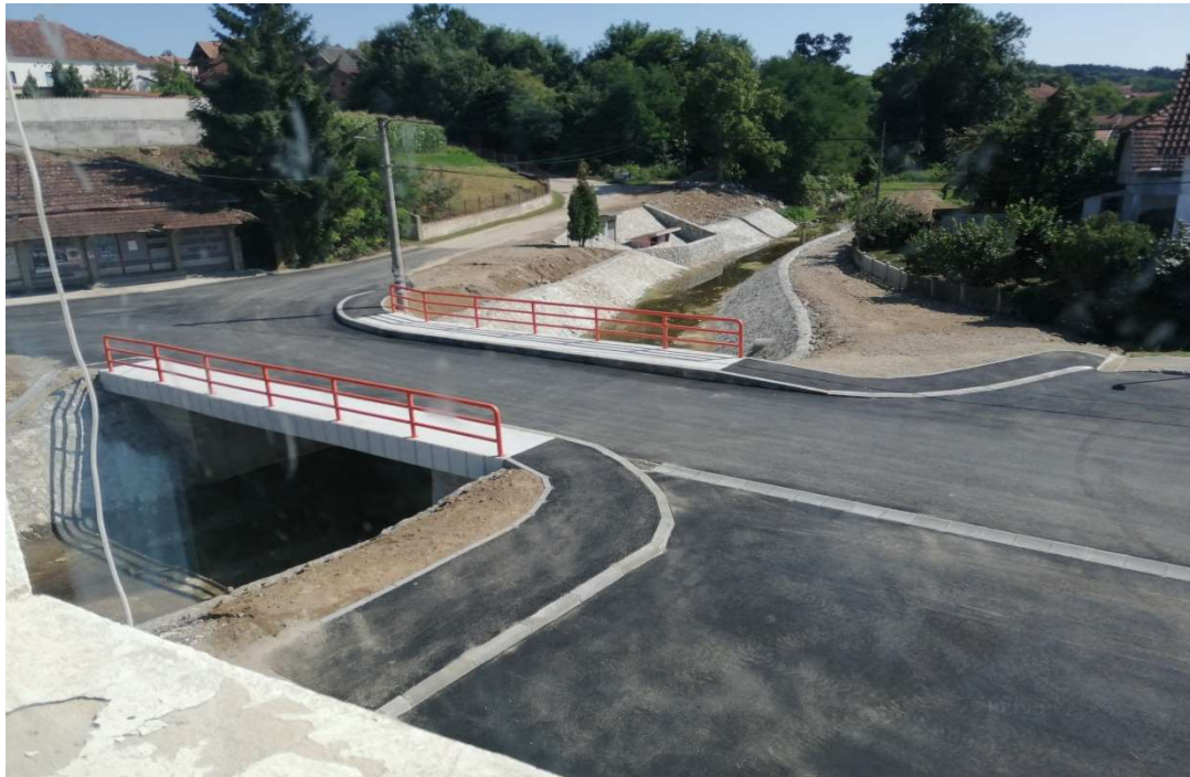
Слика 14. Објекат Реконструкција моста у насељеном месту Тропоње,