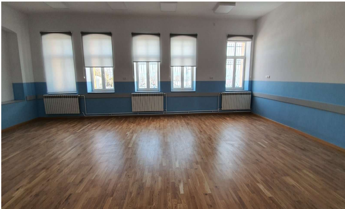
Слика 9. Грађевински радови на реконструкцији школског комплекса и изградњи помоћног објекта - котларнице и постројења за повећање притиска воде истуреног одељења ОШ "Свети Сава" у Бадњевицу, општина Баточина