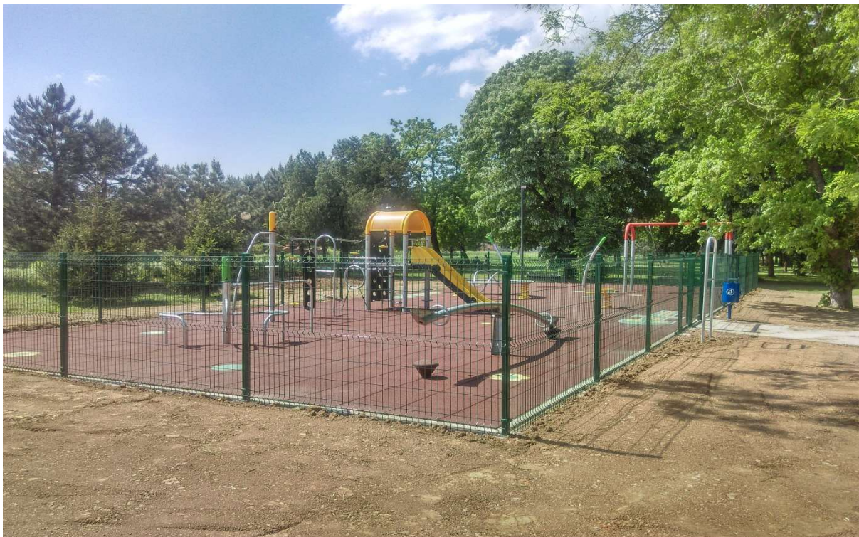
Слика 20. Објекат Изградња дечијег игралишта, Општина Свилајнац