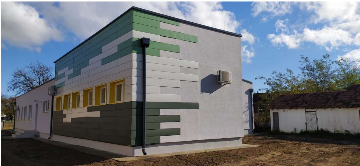
Слика 5. Изградња дечијег вртића у насељеном месту Кушиљево, општина Свилајнац