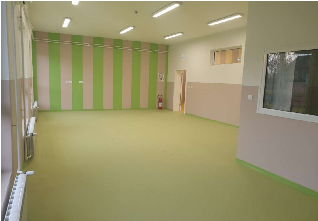
Слика 6. Изградња дечијег вртића у насељеном месту Кушиљево, општина Свилајнац