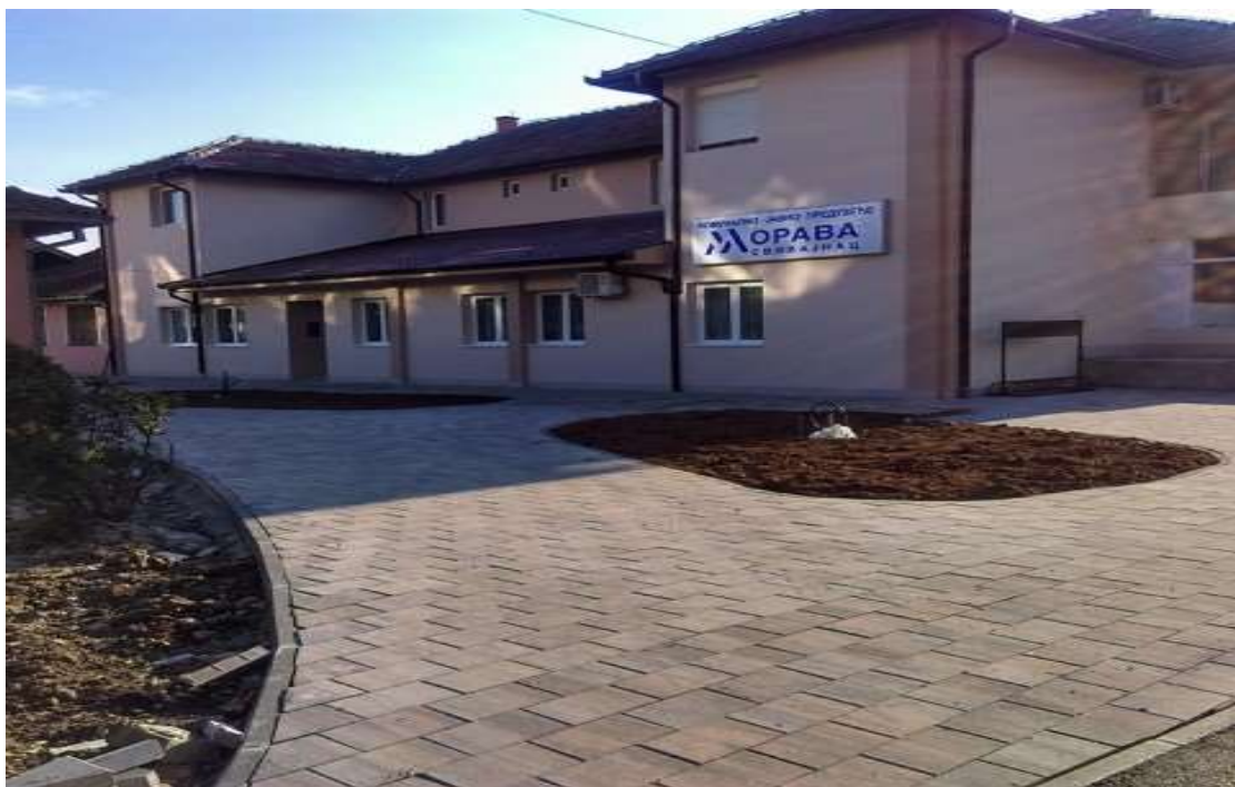
Слика 22. Објекат Поплочавање тротоара, општина Свилајнац