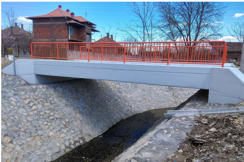
Слика 16. Објекат Реконструкција моста у насељеном месту Крњево, општина Велика Плана