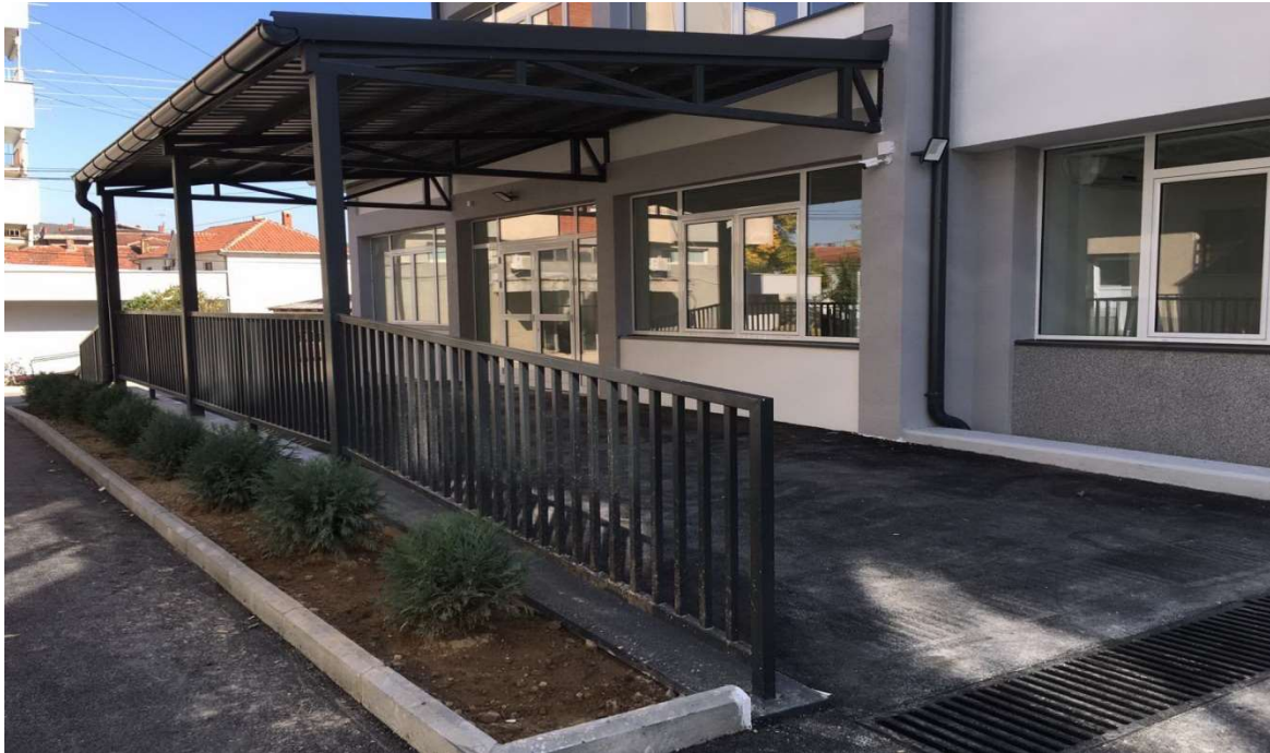
Слика 2. Дом здравља Деспотовац